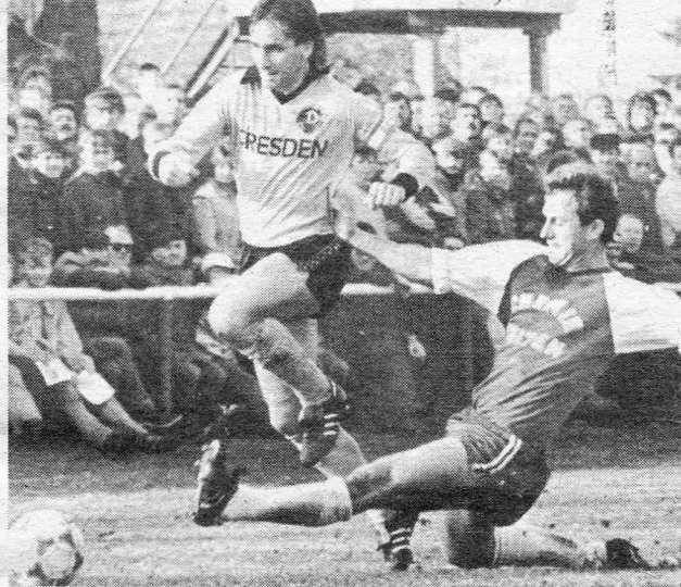
Volles Haus in Velten, wo Dynamo Dresden durch zwei Sammer-Tore gewann. Hier köpft der Dresdner vor Möckel. Im Hintergrund Pilsz, links Dylong. Foto rechts: Häfner passiert Anders, setzt an zu einem Flankenlauf.