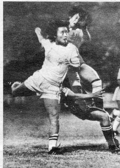
Diese jungen chinesischen Fußballspieler im Alter von sechs bis sieben Jahren zählen zu den vielen Talenten im Lande, die eine frühzeitige Ausbildung erfahren und sich dabei, wie man dem Bild oben entnehmen kann, mit großer Aufmerksamkeit der Aufgabenstellung des Trainers widmen. Daß die nebenstehende Aufnahme eine Aktion aus dem Frauenfußball festhält, möchte man bei der Dynamik und Einsatzstärke im Kampf um den Ball kaum für möglich halten. Aber es ist an dem!